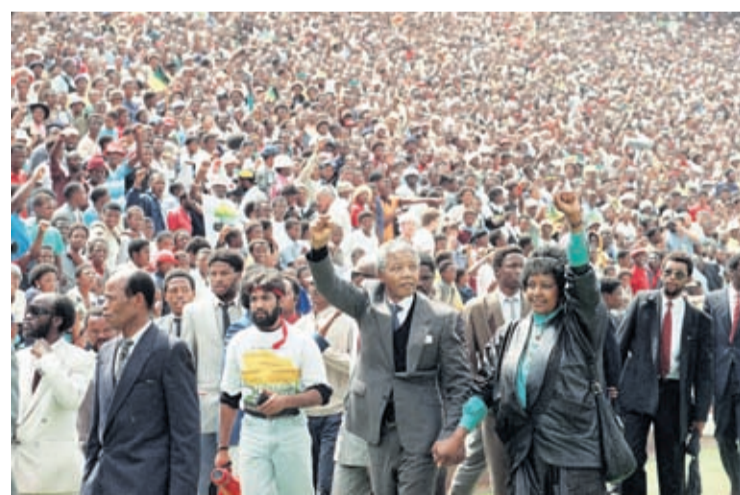
In this Feb. 13, 1990 file photo, Nelson Mandela, center left, and his wife Winnie, center right, raise clenched fists as they arrive at a welcoming rally in Soweto two days after Mandela's release from prison in Cape Town, South Africa.